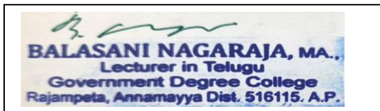
Signature of the Department in Charge: