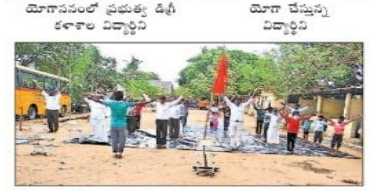
రామమూలం: యోగా సాధన చేస్తున్న పిహెచ్ఎస్ సభ్యులు

అందుకోవడానే యోగా ఎంతో ఉపయోగంగా ఉంటుందని ఎన్నో అందాల తెలిపారు. ఎన్నో కేంద్రీ తగ్గుతున్నట్లు, అందాల, హరిత, ప్రవృత్తి, ప్రత్యామ్న, మహామూలం, సహజ, విశ్వాస పాల్గొన్నారు. రామమూలం, మ్యూన్సిపల్: యోగాలో మనస్ ఉల్లాసం, అన్నీ విద్యాల ఉపయోగపడుతుందని పిహెచ్ఎస్ మండల ప్రజా కార్యదర్శి చిరారెడ్డి చెప్పారు. అదివారం యోగా దినోత్సవం సందర్భంగా యోగా సాధన చేశారు. కార్యక్రమంలో రామమూలం ఉపయోగ పాల్గొన్నారు.